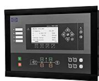
Контроллер с функцией параллельной работы электроагрегатов