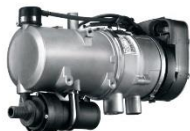
Подогреватель предпусковой дизельный «Webasto»