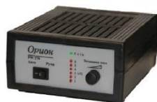
Зарядное устройство аккумуляторных батарей «Орион»