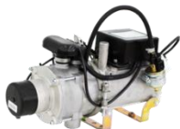
Подогреватель предпусковой дизельный «Теплостар»